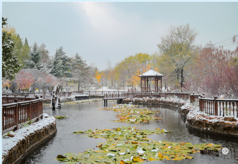
①  ②  ③  ④⑤