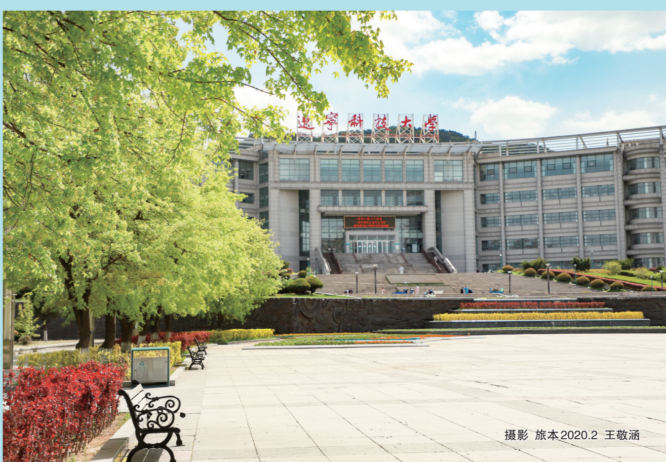
摄影 旅本2020.2 王敬涵