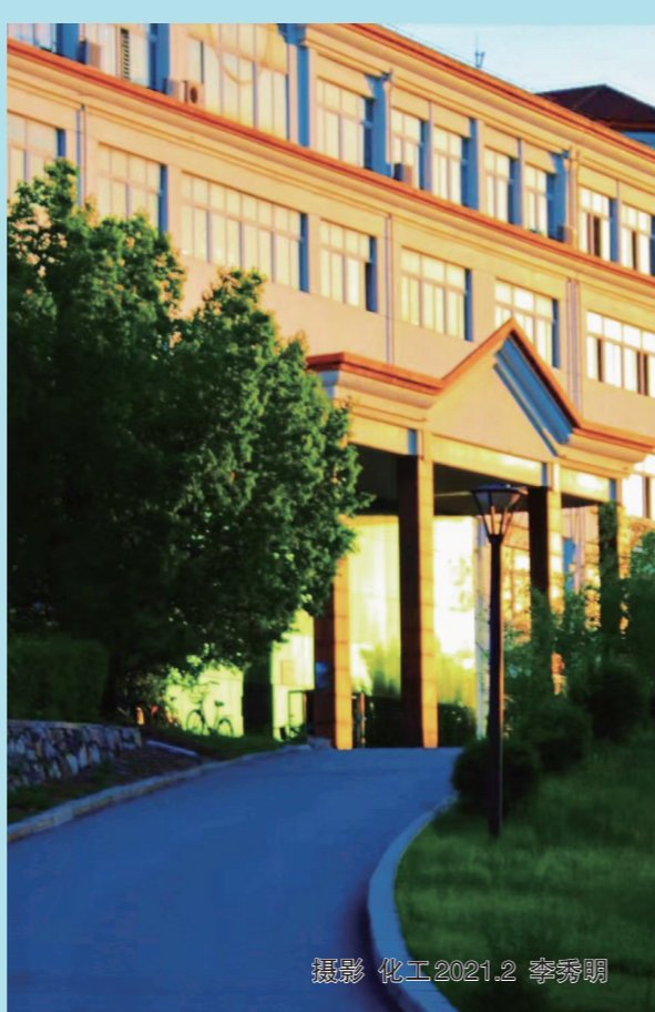
摄影 化工2021.2 李秀明