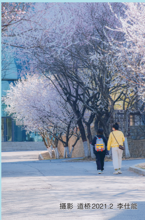
摄影 道桥2021.2 李仕能