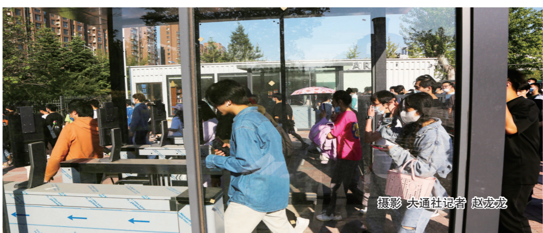
攝影 大通社記者 趙龍