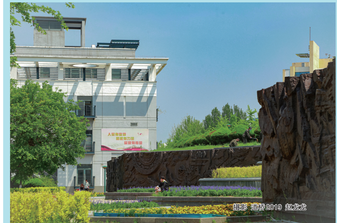
摄影 道桥2019 赵成龙