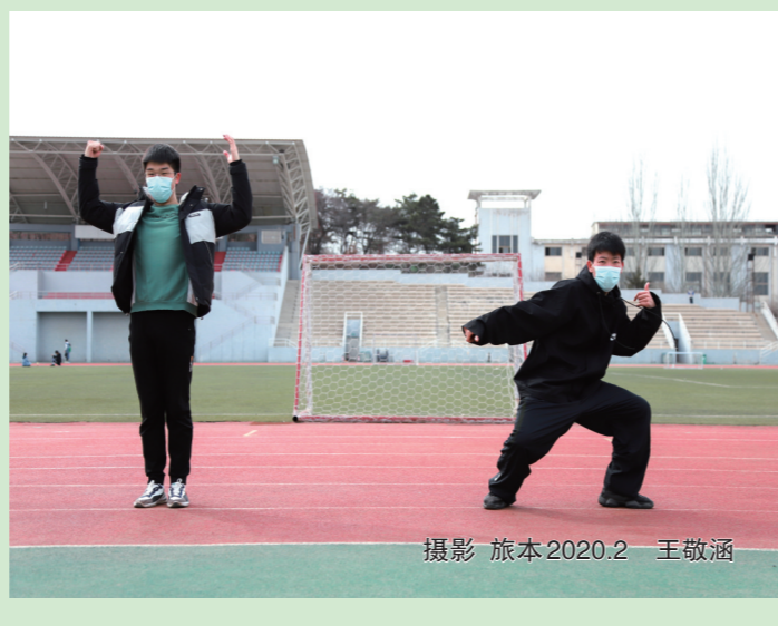
摄影 旅本2020.2 王敬涵