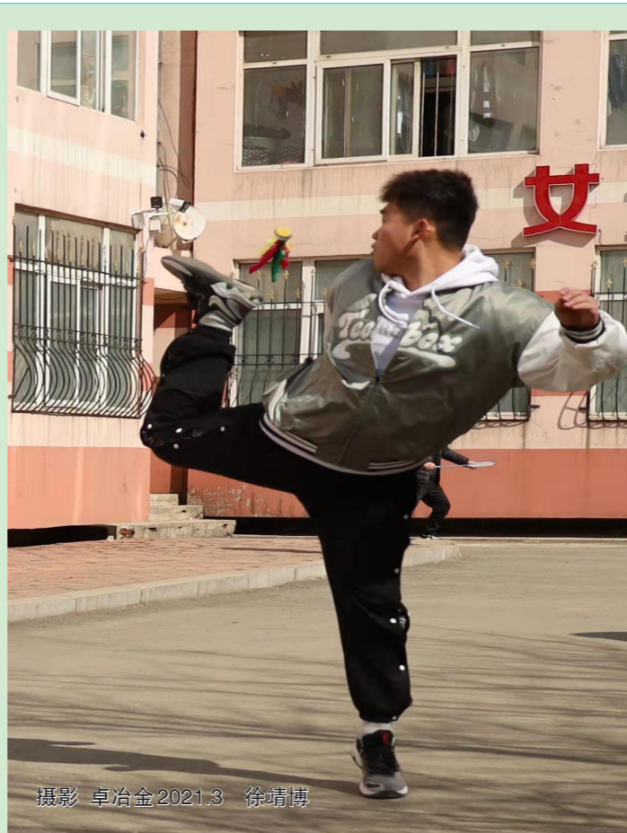
摄影 卓冶金2021.3 徐靖博

生活总有无尽的挫折和苦难，而有伤害，就一定会有温柔。我想，这或许也是青春成长里的一部分，面对挫折，更要面对未来。就如歌词里说的“感谢伤我的人，带来保护我的人”就算受重一万斤，一样也可以好好长大。