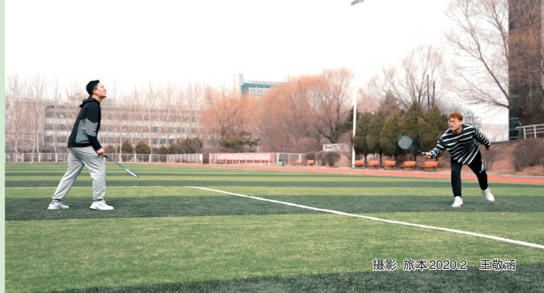
摄影 旅本2020.2 王敬涵